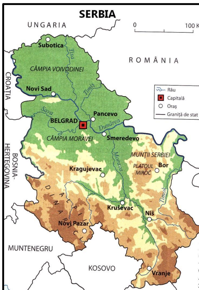
Harta fizico-geografică a Serbiei