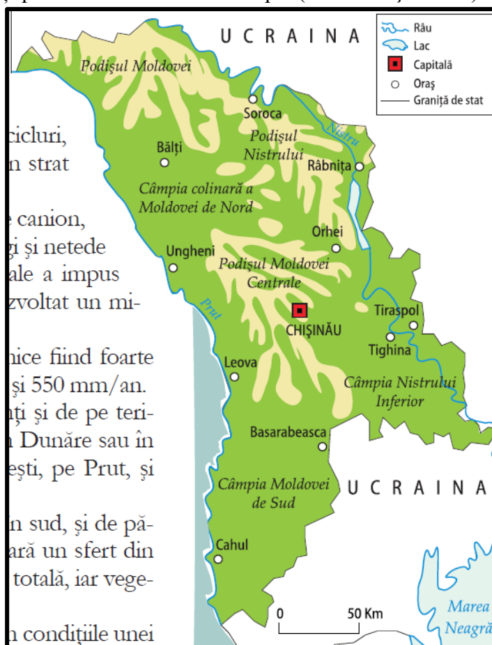
Harta fizico-geografică a Republicii Moldova